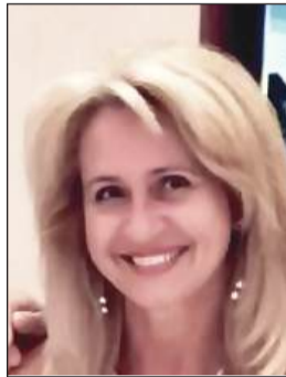
της Δρ Ευαγγελία Ράπτου

Η αγωνία και το άγχος της επαναπροώθησής τους στη χώρα προέλευσης, το πλήθος των ασυνόδευτων ανηλίκων, ο υπερβολικός συνωστισμός συχνά ατόμων και των δύο φύλων, η έλλειψη νερού, τα χαλασμένα τρόφιμα, οι ανθυγιεινές συνθήκες διαβίωσης, η πολύωρη αναμονή για καθαριότητα και τουαλέτα, τα προβλήματα του πρόχειρου αποχετευτικού συστήματος, η ανεπαρκής υγειονομική περίθαλψη, η έλλειψη ή η ανεπάρκεια αστυνομικής προστασίας, ακόμα και η αστυνομική βία, με πλήθος συνοδευτικών προβλημάτων, προσβάλλουν ανεπανόρθωτα την ανθρώπινη αξιοπρέπεια. Γι' αυτό οι συνθήκες που περιγράφουν τα μέσα μαζικής ενημέρωσης, έντυπα και ηλεκτρονικά, για