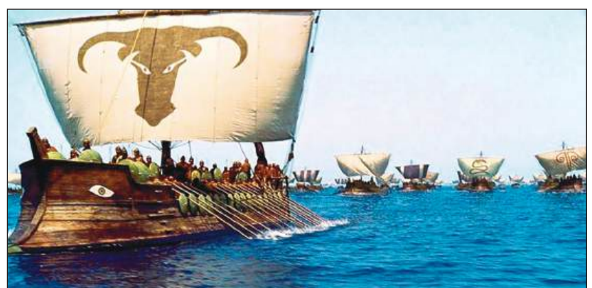
Η Β΄ ραψωδία της Ιλιάδας και η Περραιβική Δωδώνη εικόνα 2