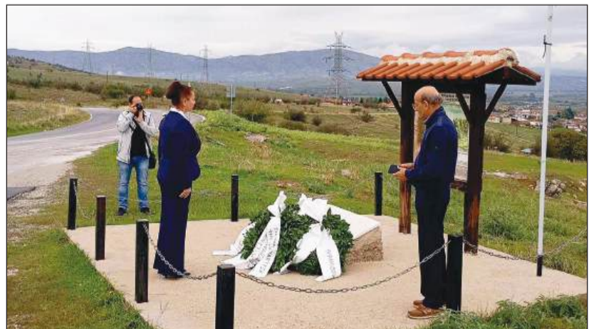
Σάββατο 5 Οκτωβρίου 2024. Επιμνημόσυνη δέηση για τους αγωνιστές του 1912 και την απελευθέρωση των Αραδοσιβίων